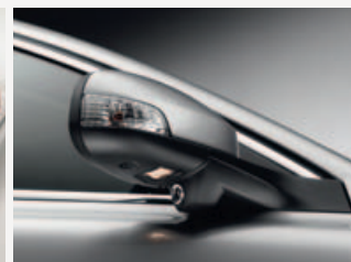
Blind Spot Information System - BLIS