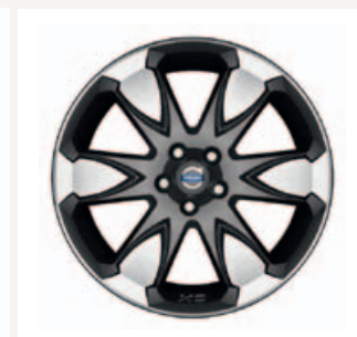
19" Erakir, XC70