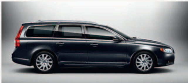
Volvo V70 in Savile Grey metallic met 17" Saga lichtmetalen velgen