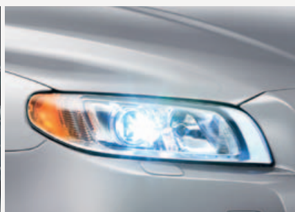
Dual Xenon koplampen met adaptieve bochtverlichting