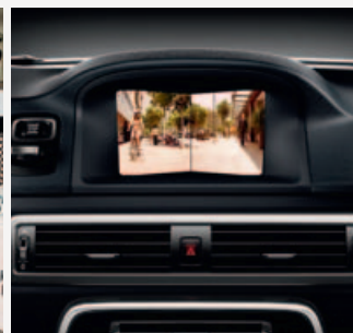
Front Blind View Camera