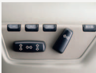
Elektrisch verstelbare bestuurderstoel met geheugen