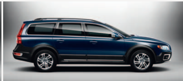
Volvo XC70 in Caspian Blue metallic met 17" Valder lichtmetalen velgen