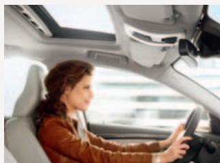
Elektrisch bedienbaar glazen schuif-/kanteldak