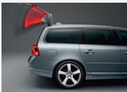
Elektrisch bedienbare achterklep