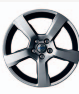
18" Cratus, V70