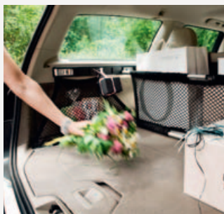
Cargo fix kit

1) Prijzen zijn inclusief BTW en montage.